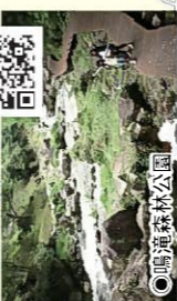
●鳴滝森林公園 何不讓我們的身心在小溪谷間放鬆， 去感受四季五彩繽紛的色彩！