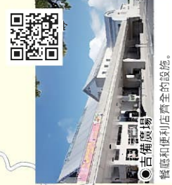
吉備廣場 餐廳和便利店齊全的設施。