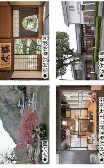
●足守藩侍邸宅 ●足守廣場 富有濃厚韻味的江戸時代的街道陣屋町。 各設施的詳細內容請通過右側的條形碼確認。