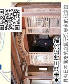
●重森三吟紀念館 具有日本風格的庭園研究專家的紀念館

連續傾斜路段 約4.8km 標高: 329m 平均傾斜度 / 約4.2% 標高: 100m