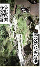
●鸣濑森林公园 请来四季变换风情万种的委员会 放松身心享受美好休闲时光吧!