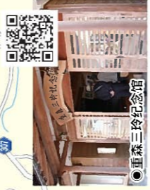
●重森三铃纪念馆 具日本风格的庭园研究家纪念馆