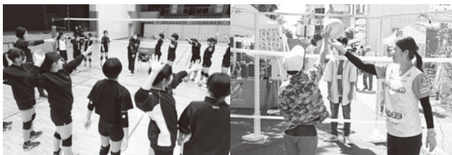
バレーボールの普及・発展・強化 (写真:岡山市 部活動地域移行モデル事業)