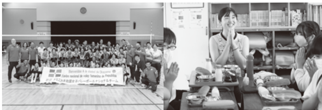
海外代表チームの強化合宿受入 (写真:ドミニカ共和国ナショナルチーム)

岡山シーガルズは国内バレーボール競技のトップカテゴリーであるSVリーグに所属するチームの中でも数少ない地域密着型市民クラブチームです。競技活動以外にもバレーボール教室や各種啓発活動をはじめ年間200回にも及ぶ地域活動に積極的に取り組んでいます。