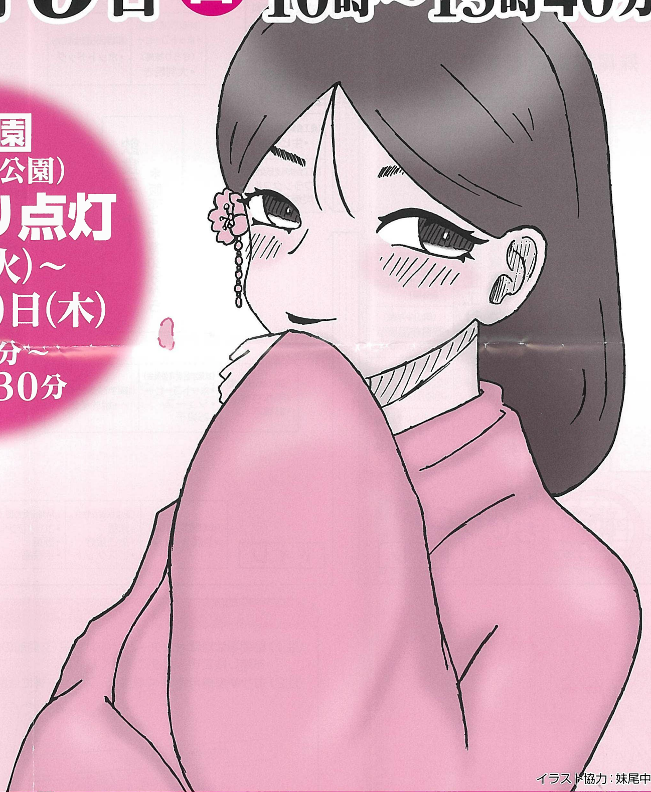
イラスト協力:妹尾中学校