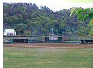
●多目的広場(野球場)