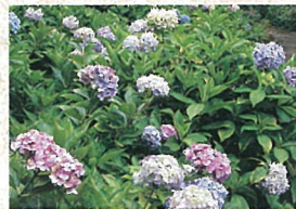
7 アジサイ 雨にぬれたアジサイは風情があります。