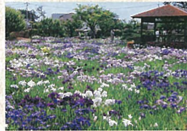
5 ハナショウブ園 4,000㎡、回遊式庭園に150品種15,000株のハナショウブが落ちついた雰囲気をかもし出します。