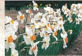
10 スイセン 見頃は3月中旬から3月下旬。