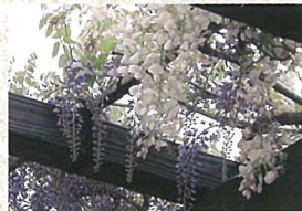
3 8 フジ棚 見頃は4月下旬から5月上旬。みことなフジのカーテンをお楽しみ下さい。50mと20mの2つ。