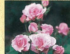
B プリンセスアイコ 敬宮愛子内親王殿下のご誕生を祝して名付けられたバラです。蕾から巻いた花弁がひらいていく様子が優雅でも美しく、皇太子ご夫妻の愛情に包まれた愛らしい内親王様そのもののイメージの花です。花付きが良く、長く咲き続けます。2001年JRC銅賞受賞。