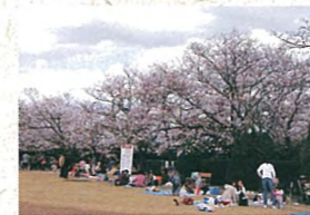
15 桜 お花見に最適です。