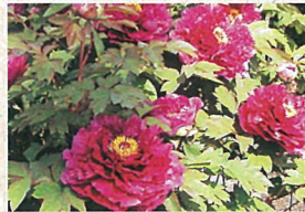
6 ボタン園 50品種、1,000株のボタン。中国洛陽ボタンも。2月上旬には冬ボタンも楽しめます。