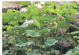
9 大賀ハス 2,000年以上前の古代ハスで見頃は、6月下旬～8月中旬までです。