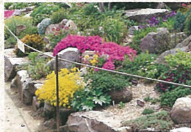
4 ロックガーデン 160㎡、自然な石組の中に100種の山野草で彩られています。