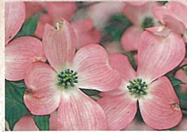
1 ハナミズキ 春は花、秋は紅葉と実が美しい。