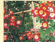
C カクテル 黄色は翌日には白くなるため、底白の花にも見えます。冬に切り詰めてもよく咲き、枝が太くないため様々な誘引や仕立て方ができます。花付きが良く、耐病性に優れているため広く知られている銘花です。名女優ロミー・シュナイダーに捧げられました。