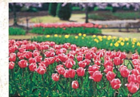
12 チューリップ 早咲き種は4月上旬から開花し、1万球のチューリップが園内を彩ります。