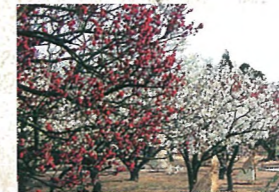
11 梅園 しだれ梅、紅白梅など15品種150本の梅林が春の訪れを知らせてくれます。