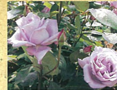
A ブルームーン 耐病性に優れた藤色の代表花のひとつです。この色彩と香の豊かさが永年の銘花の由縁です。