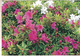
2 ツツジ 約5,000本のヒラドツツジがバラ園の外周を囲むように咲きます。