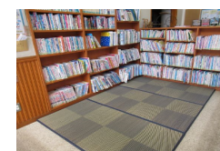
公民館置コーナー