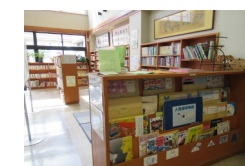
紙芝居・絵本もあるよ

公民館1階ロビーは誰でも利用できます。図書の貸し出しもしています。子どもたちに大人気の畳コーナーもあります。子どもさんと一緒にお気軽にお越しください。