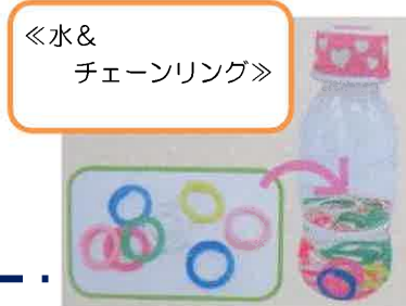
「水&チェーンリング」