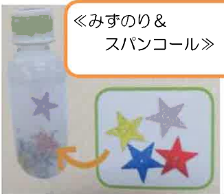
「みずのり&スパンコール」

これから、暑い日が続き、外に出にくくなりますね。 そんな時は、お家でセンサーボトルを使って遊んでみてはいかがでしょうか？ ペットボトルやジップロックの中で、水と一緒に揺れる素材が涼し気ですね。 ユニークな落ち方を発見したり、音が鳴ったり…。色々な素材を試してみるのも楽しそうですね。