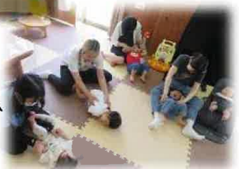
「一本橋こちょこちょ」 くすぐったい！！