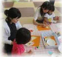
カタツムリの時計を作ったよ♪