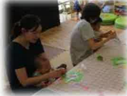
カエルの傘、上手に作れたね♪