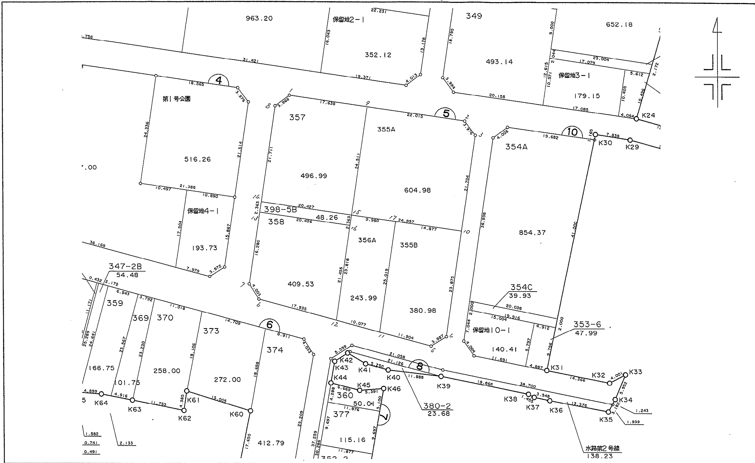
図 地 画 ( 5 ブ ロ ッ ク )