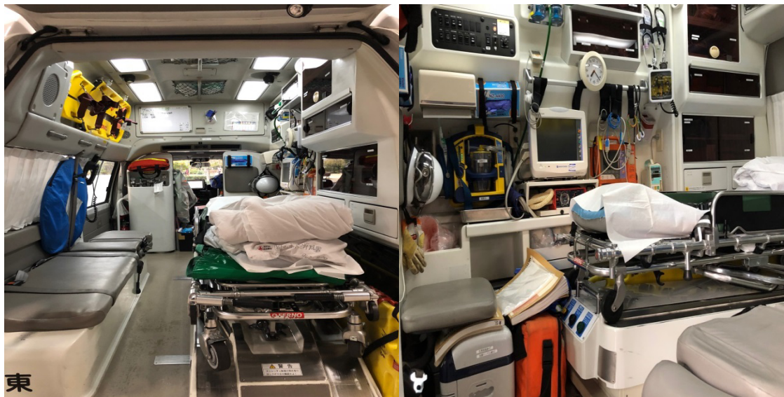
救急車内を大公開