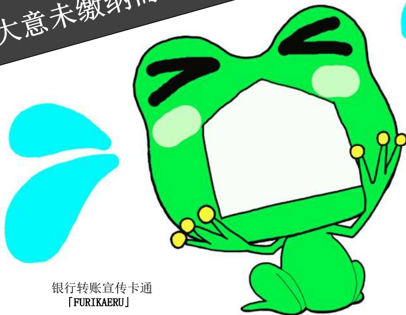
银行转账宣传卡通 [FURIKAERU]