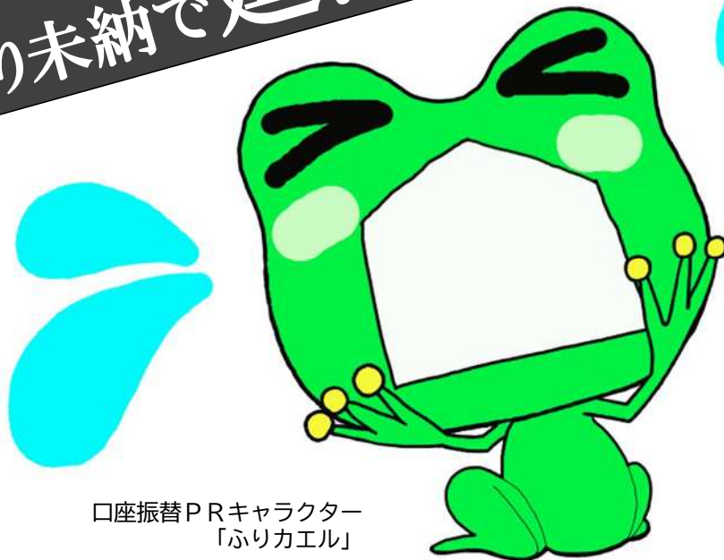
口座振替PRキャラクター 「ふりカエル」