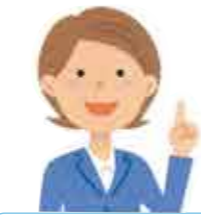
主任介護支援専門員 (主任ケアマネジャー)