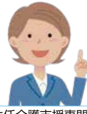
主任介護支援専門員 (主任ケアマネジャー)