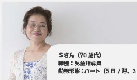
Sさん (70歳代) 職種：児童指導員 勤務形態：パート (5日/週、3時間)

退職後、時間を有効に使いたい、以前から関心のある仕事をしたかったことが就職のきっかけでした。本事業の支援を受けて、就職後も困ったことがあれば相談員に気軽に相談できるので安心しました。また、以前働いていた時に比べて、今はいたわりの言葉がスムーズに出るようになり、友だちから「最近優しくなったね」と言われます。自分自身の変化や成長を感じられて嬉しいです。