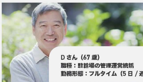
Dさん (67歳) 職種：駐給場の管理運営統括 勤務形態：フルタイム (5日/週)

就職を志したのは、生きがいのためです。退職後は、前職を頑張ってきたのでゆっくり自分の時間を楽しもうと思っていました。しかし、人との関わりがなくなり、社会とのつながりがなくなったように感じ、なにかできないかと思い始めました。会社に入ってから、同僚と会話するなかでお互いの考え方の違いがわかり、刺激を受けています。