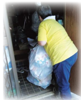
▲ゴミ出しをサポートします