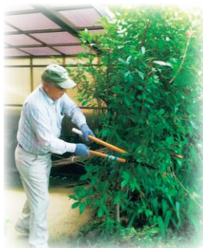
▲庭木の剪定をしています