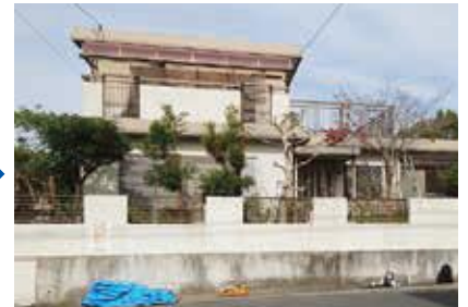
ご近助くらぶにかかるとスッキリ