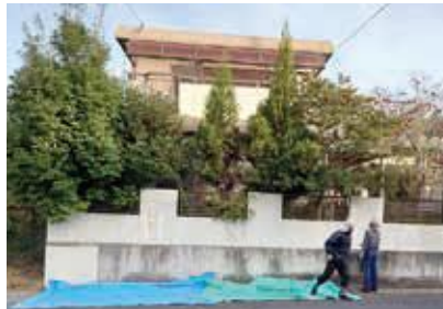
伸び放題になった庭木も

最初のご利用は、「不慮のけがでしばらくの間、家事ができないので支援して欲しい。」と電話をかけてきた方でした。早速、面談に伺い、家事支援で登録されたサポーターを派遣することとなりました。コーディネートも初めてなら、サポーターも初めてです。手探りのスタートでしたが、仕事ぶりをお褒めいただくとともに、私たちの活動を評価していただいたことは、この上ない喜びでした。