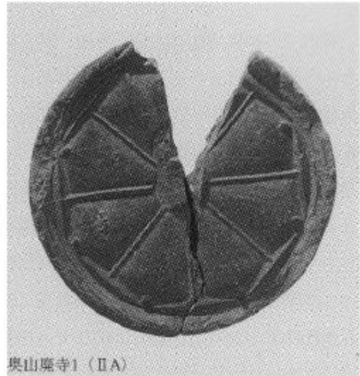
奥山久米寺（奈良県）の同型瓦