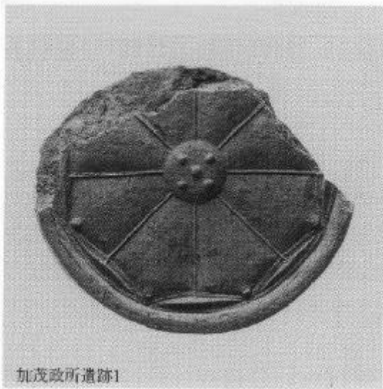
加茂政所遺跡の同型瓦