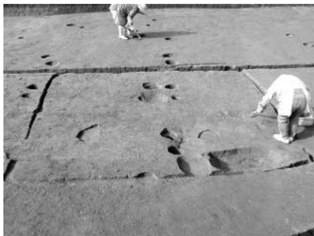
竪穴式住居（古墳時代）