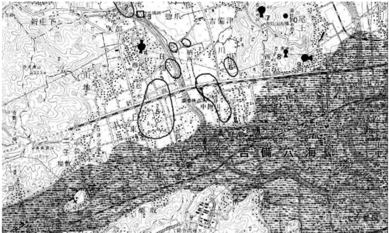
調査地点の位置と周辺の遺跡

川入・中撫川遺跡は岡山市川入、中撫川にまたがる大遺跡です。以前には山陽新幹線建設や新幹線測道の建設に伴って発掘調査され、岡山県南部の代表的遺跡として広く知られています。このたびは都市計画道路吉備環状線(市道中撫川平野線)建設に伴い発掘調査を実施しました。2年間にわたる発掘調査で弥生時代前期から中世に至る各時代の遺構・遺物が見つかっています。