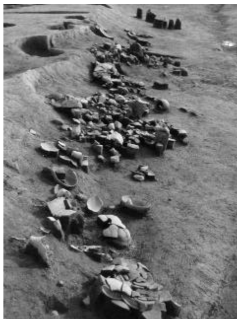
溝群土器出土状況（古墳時代）

出土遺物が爆発的に増加します。調査範囲はムラの縁辺部にあたるようで、水路が何本も、何度も掘り直されながらほぼ南北に存在しています。水路より東側では住居跡や井戸などの遺構が見つかります。遺物の多くは井戸や水路に捨てられたりしていた土器です。中には網のおもりや製塩土器など海との関わりをうかがわせる遺物もみつかります。