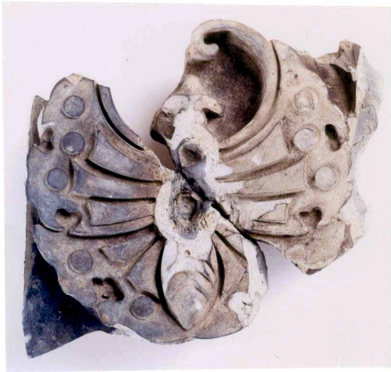
おにがわら あげはちょうもん いけだけ かもん 鬼瓦（揚羽蝶紋：池田家の家紋）