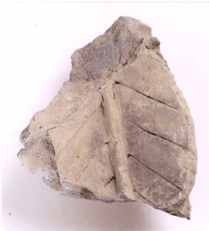
おにがわら きりもん うき たげ かもん 鬼瓦（桐紋：宇喜多家の家紋）