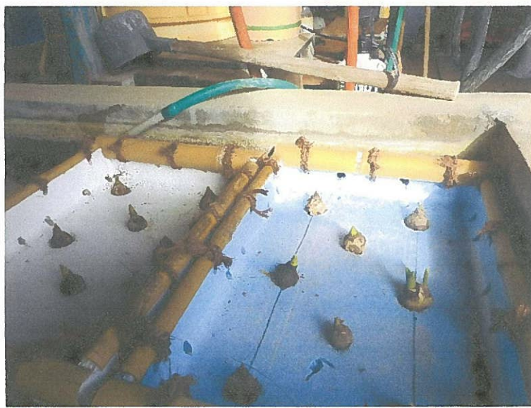
3月はヒヤシンス花筏の準備中です