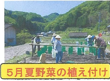
5月夏野菜の植え付け