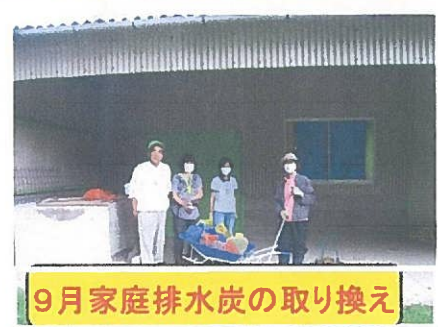
9月家庭排水炭の取り換え