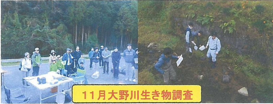
11月大野川生き物調査