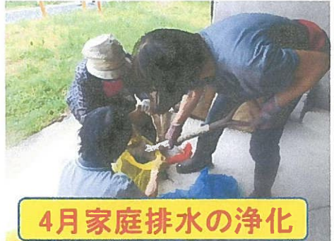
4月家庭排水の浄化