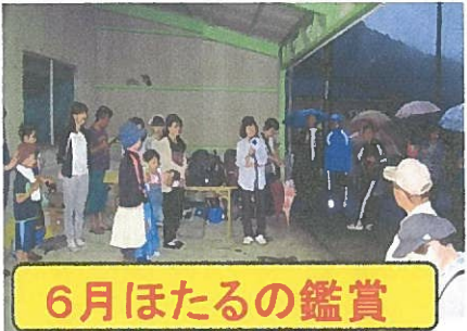
6月ほたるの鑑賞 会