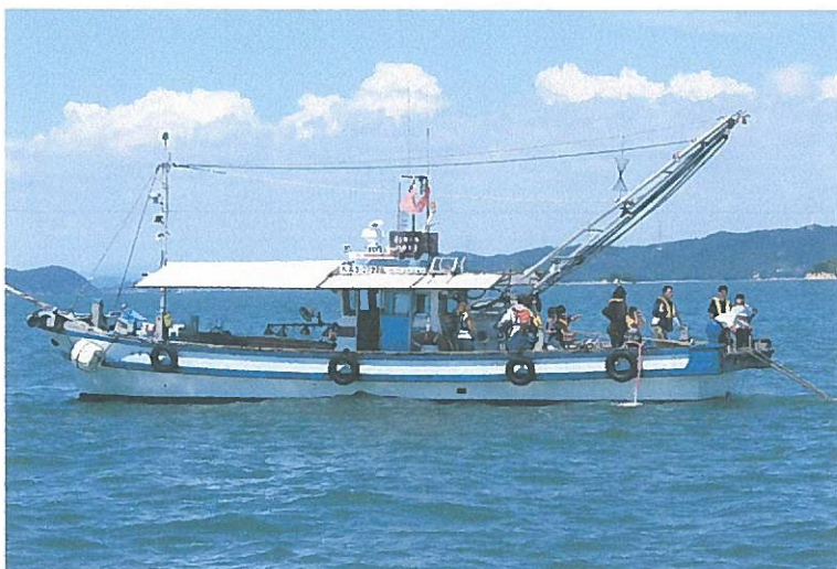
底曳網船による回収の様子