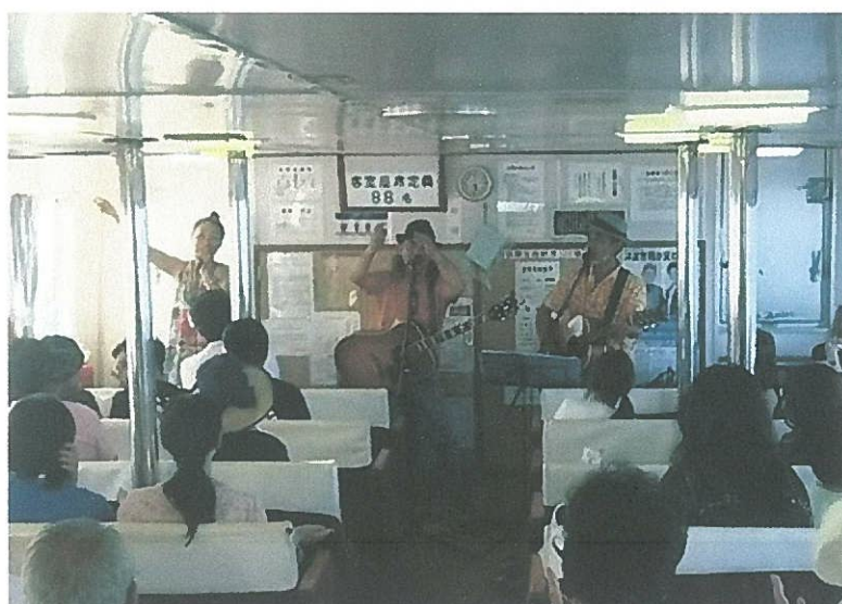
ぬくだま船内ライブ