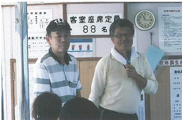
四海漁協組合長による説明