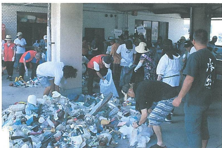
ごみ分別・計量作業