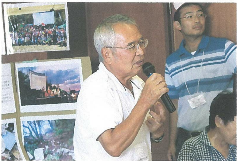
千葉先生による講評