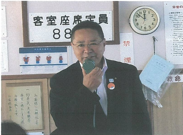
船内行事 土庄町長あいさつ