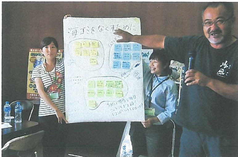
グループによる発表