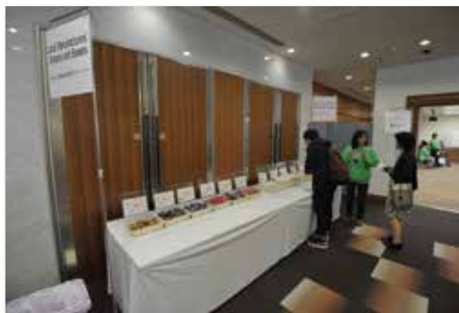
地元企業のお菓子の提供コーナー