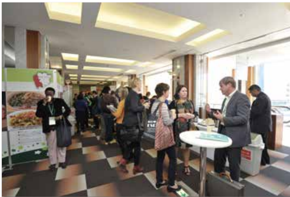
賑やかな雰囲気の会場の様子