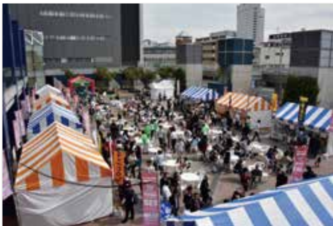
屋外広場の全景(OCC 屋外広場)