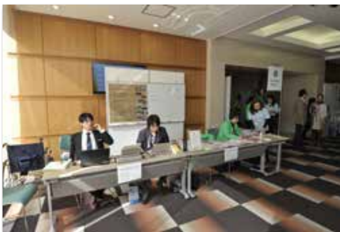
情報発信カウンター