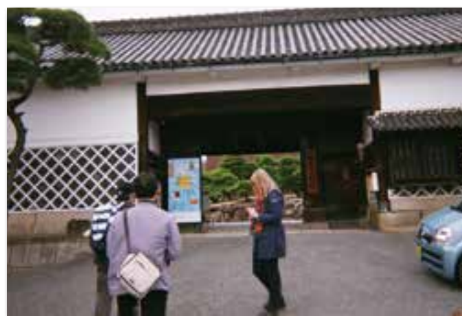
林原美術館前にて(岡山市)