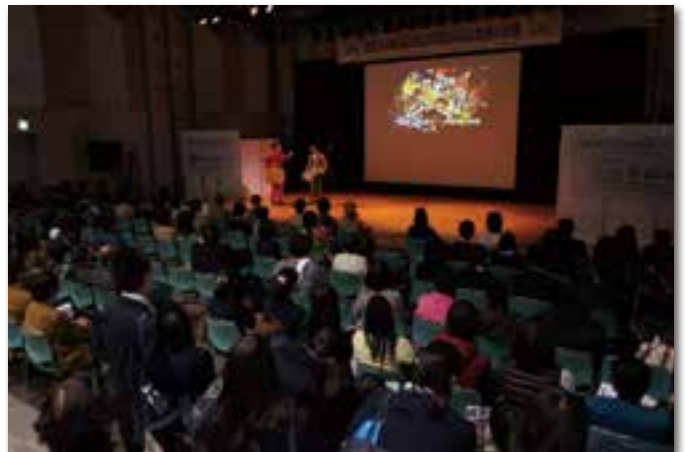
ステージイベント(OCC1階 イベントホール)