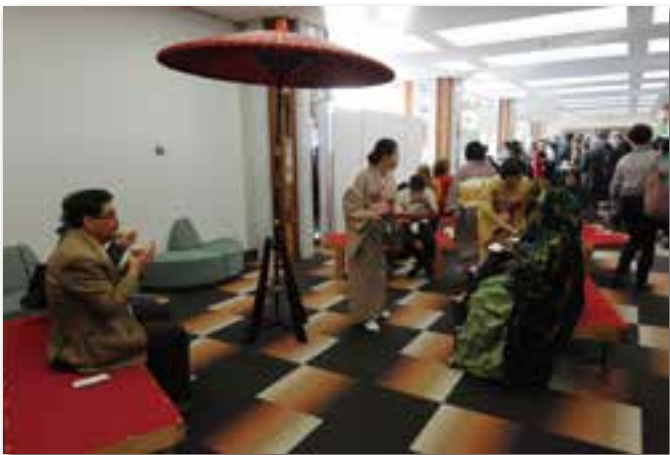
会議の合間に一息