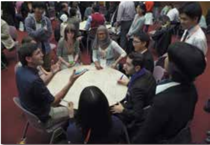
ユネスコESDユース・コンファレンス