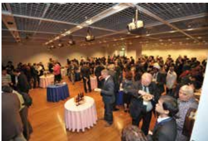
交流会の様子(3階 イベントホール)