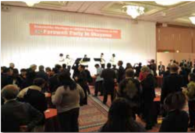
岡山市ジュニアオーケストラによるウェルカム演奏