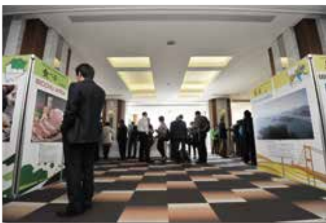
岡山の紹介コーナー(パネル展示)