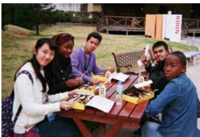
恐竜公園にて(笠岡市)