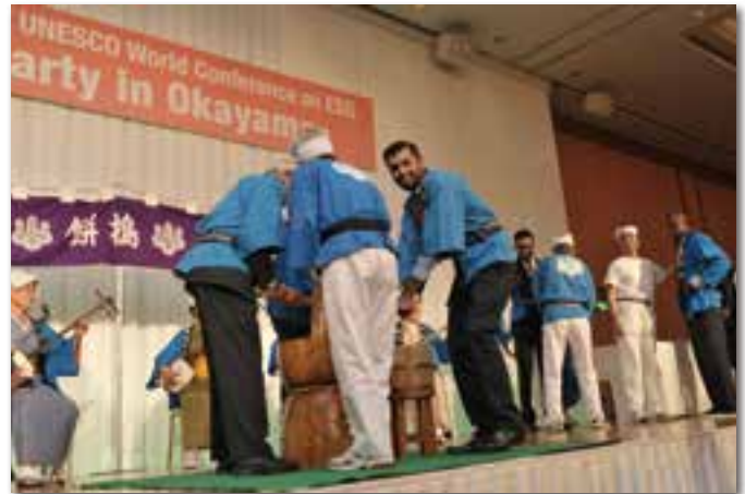
三味線餅つきを体験する会議参加者