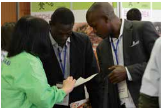
おもてなし交流エリアにて