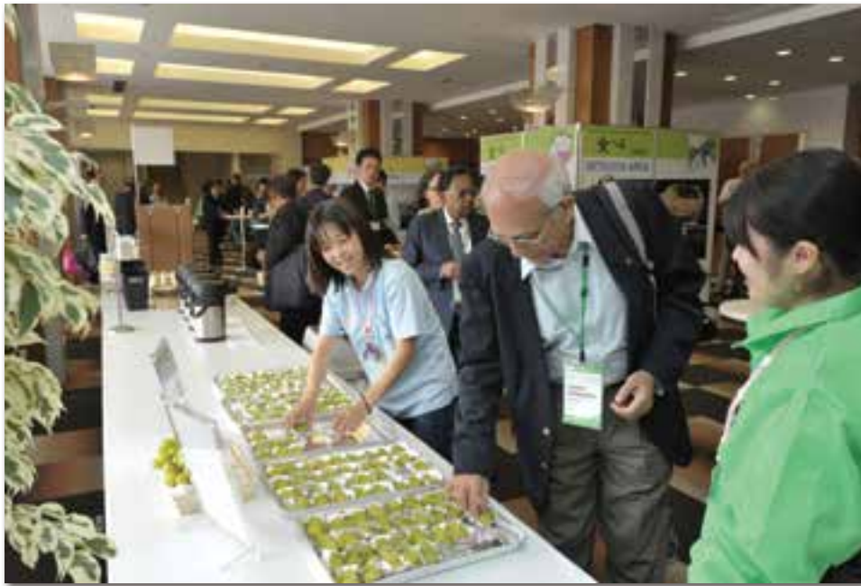
岡山特産のぶどうの提供