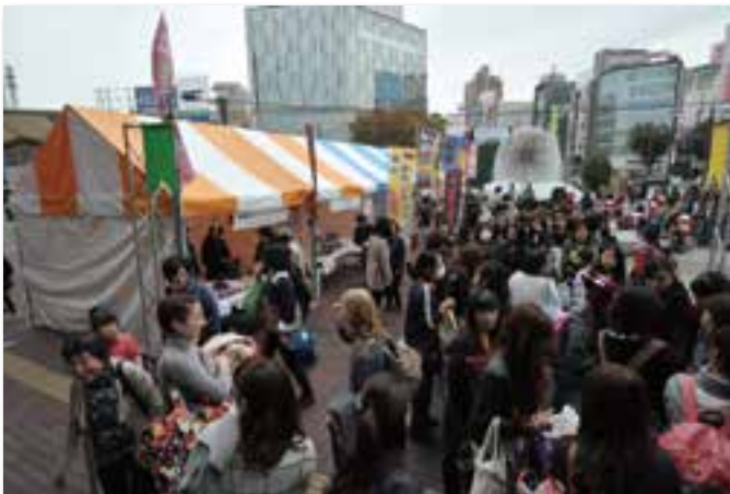
ブース出展の様子(岡山駅東口駅前広場)