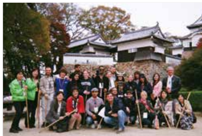
備中松山城にて(高梁市)