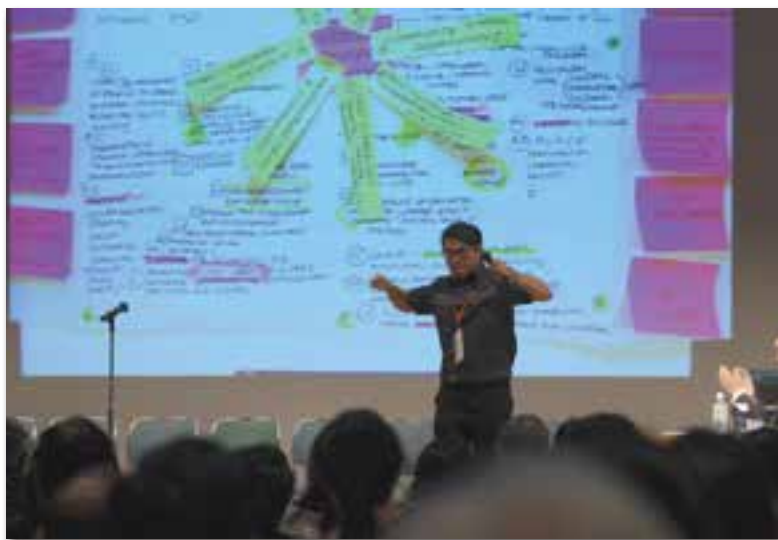
ESD推進のための公民館-CLC国際会議