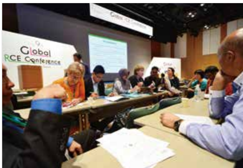
第9回グローバルRCE会議