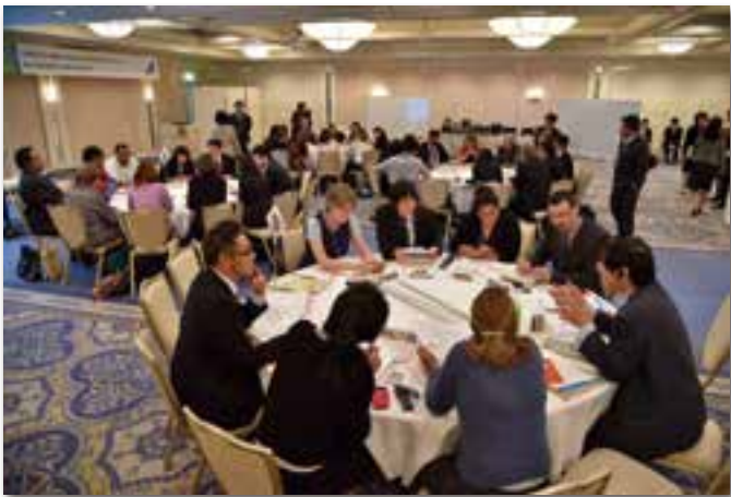
ユネスコスクール世界大会(教員フォーラム)