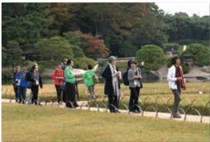
フィールドトリップにて(第9回グローバルRCE会議)