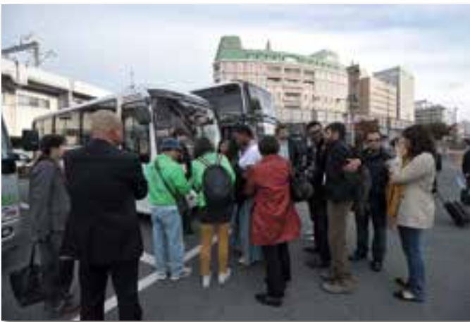
エクスカーション出発の案内