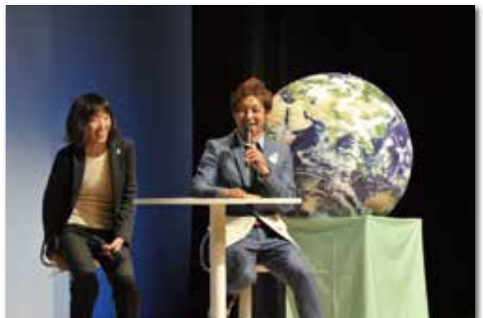
つるの剛士の「子どもたちの未来のために」～いっしょに考えようESD (OCC3階 コンベンションホール)