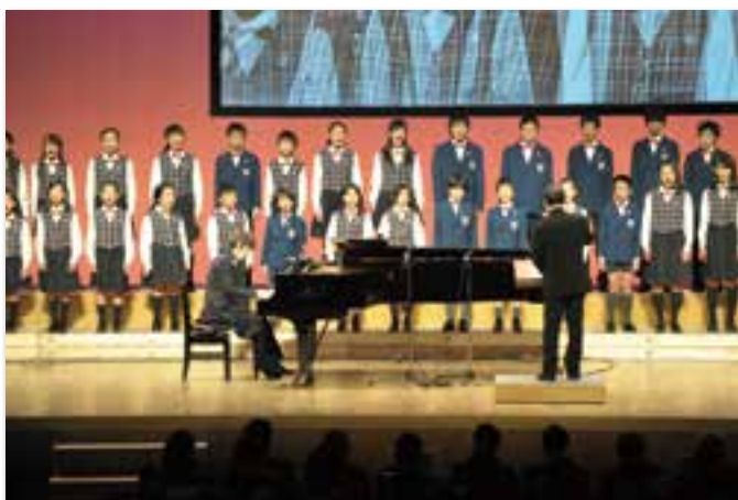
ユネスコ平和芸術家 城之内 ミサ氏と 地元合唱団との文化パフォーマンス