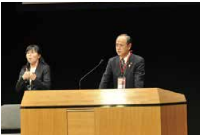
大森 雅夫 岡山支援実行委員会会長(岡山市長)による開会挨拶