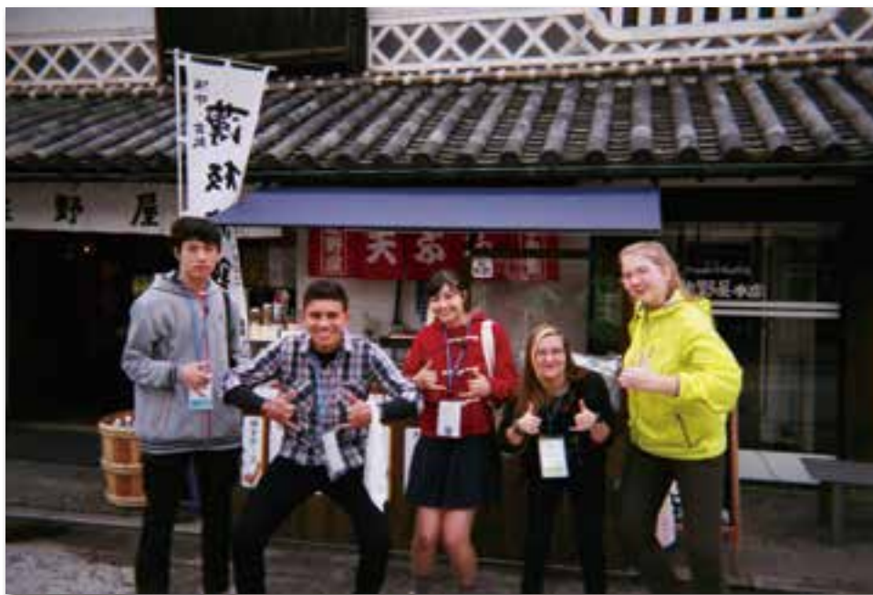
矢掛本陣にて(矢掛町)