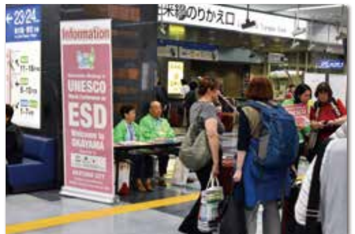
JR岡山駅新幹線コンコース内での案内