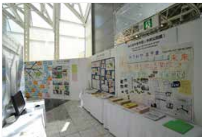
公民館におけるパネル展示(OCC2階 アトリウム)