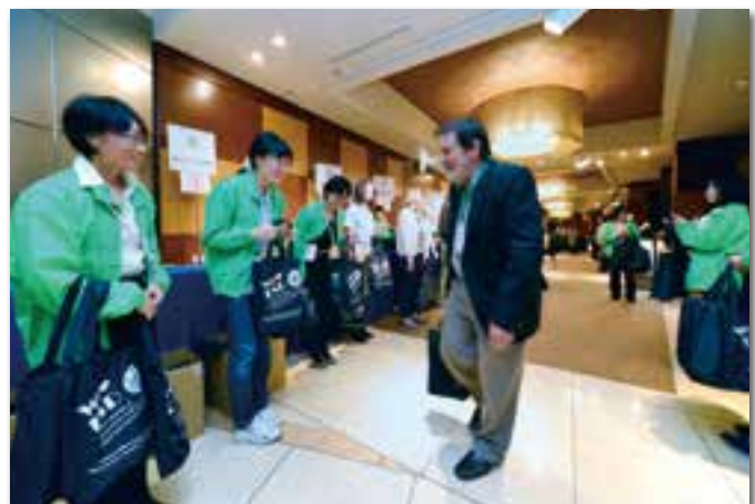
受付にてお出迎え(第9回グローバルRCE会議)