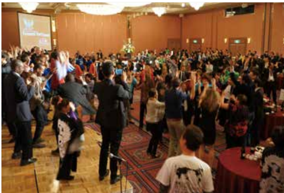
うらじゃ総踊りで盛り上がる会場内