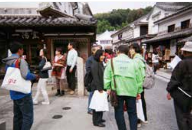
エクスカーションに同行して参加者をサポート