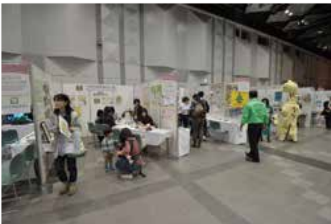
ブース出展の様子(OCC1階 イベントホール)