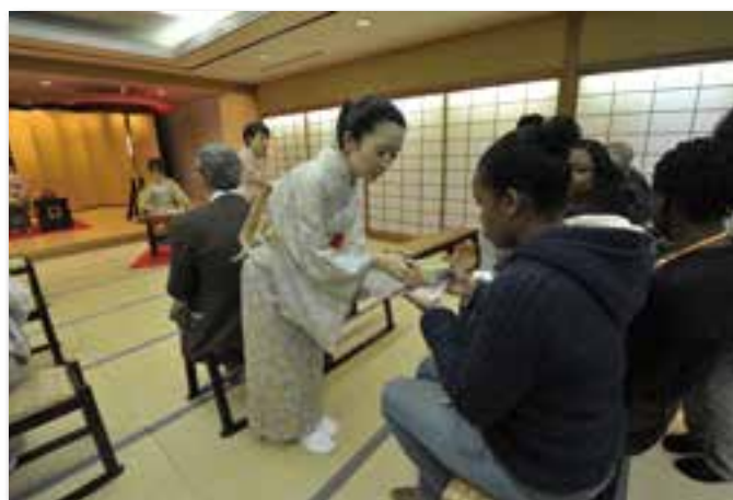
呈茶のおもてなし(3階 和風ホール)