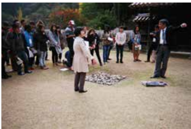
旧閑谷学校にて(備前市)