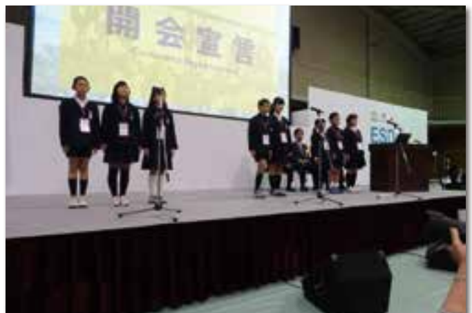
ユネスコスクール全国大会