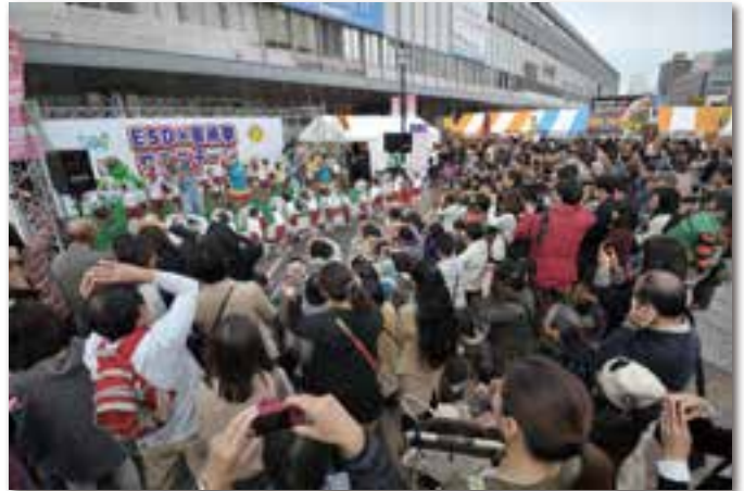
ステージイベント(岡山駅東口駅前広場)