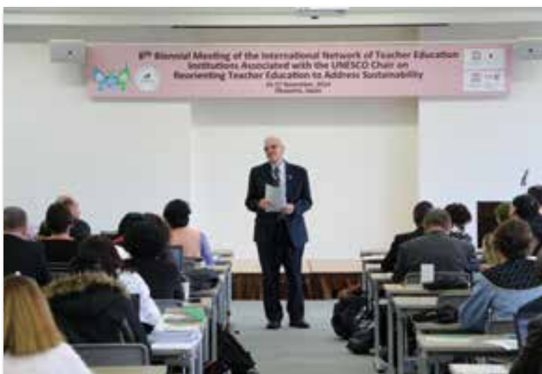
教師教育に関する国際会議