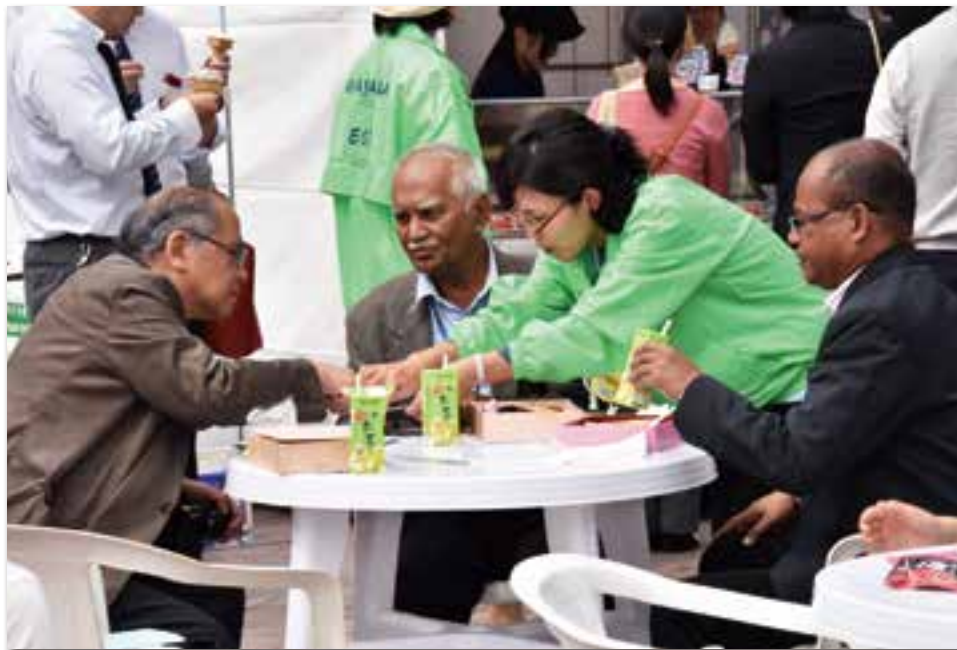
未来へつなごう! おかやまESDふれあい広場でのサポートの様子