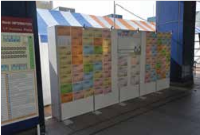
「未来へつなぐメッセージ」展示(OCC 屋外広場)