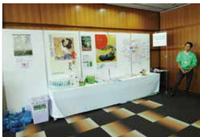
岡山の紹介コーナー(パンフレットコーナー)