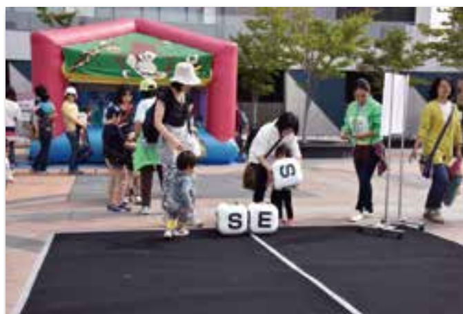
サイコロゲームの様子(OCC 屋外広場)