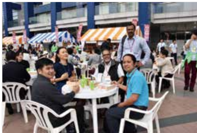
会議参加者の昼食の様子(OCC 屋外広場)