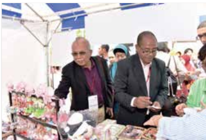
特産品等販売の様子(OCC 屋外広場)