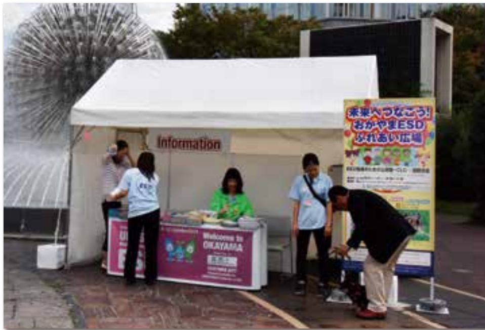
インフォメーション