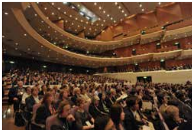
参加者で埋め尽くされた会場内の様子