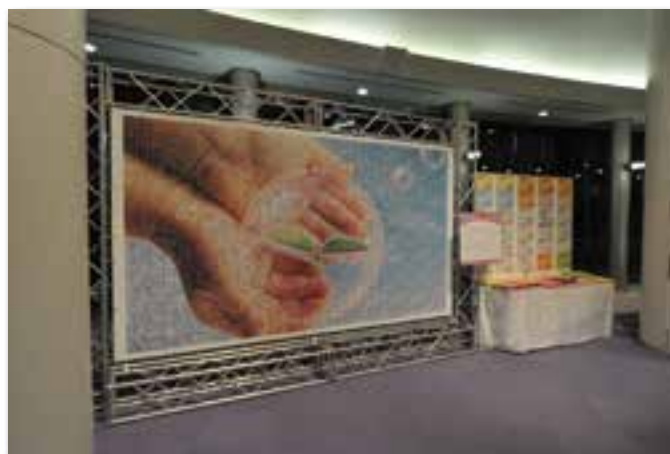
会場内に設置されたフォトモザイクアート(4階 ホワイエ)