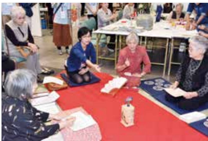
上南公民館「笑扇会」による投扇興の体験(OCC1階 イベントホール)