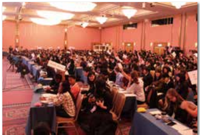
ユネスコスクール世界大会(高校生フォーラム)