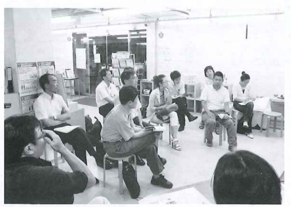
▲ざっくばらんな雰囲気で見聞交換が行われる

初回の4月は、震災があったことを受けて、「震災から持続可能な社会について考える」というテーマで開催され、話題提供者として福島県川内村から避難して来られた人が入り、活発な意見交換が行われました。