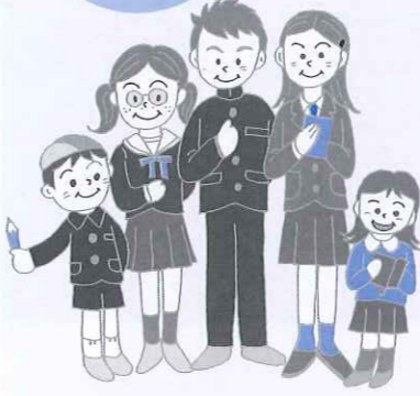
藤田地区の連携の歩み