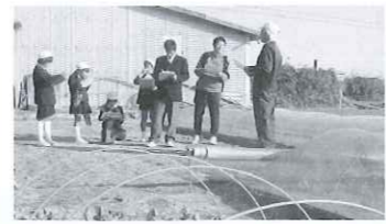
▲藤田地区の農家でインタビューに挑戦する子どもたち

岡山市南部に広がる干拓地である藤田地区は、米づくりなどの農業が盛んな地区です。この藤田地区にある小学校3校と藤田中学校、県立興陽高等学校が、3年前から総合的な学習の時間を中心に、連携してESDに取り組んでいます。