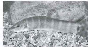
(高島地区) アユモドキは旭川と吉井川 水系、京都府の淀川水系のみに生息