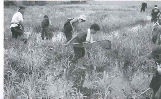
(高島地区) 賞田地区の休耕田でアユモ ドキが産卵を行っている