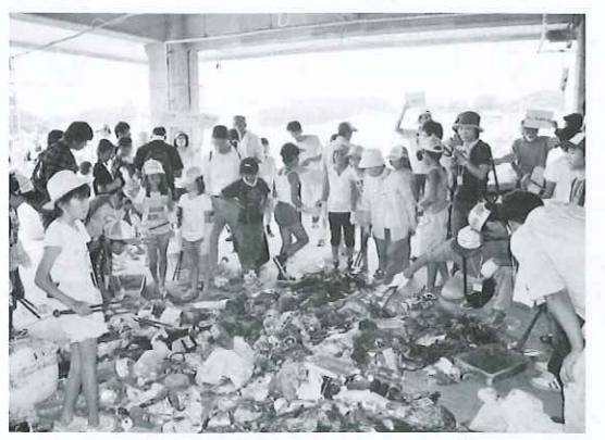
▲こんなにたくさんの海底ゴミが…

この「グリーンパートナーおかやま」が、子どもとその親を対象に行っているイベントのひとつが「ワクワクキッズ海底探検隊」という海底ゴミ回収底引き網体験学習です。このイベントは、岡山の山や川、海に捨てられたゴミが海流の関係で小豆島の近くの海底に堆積しているとい