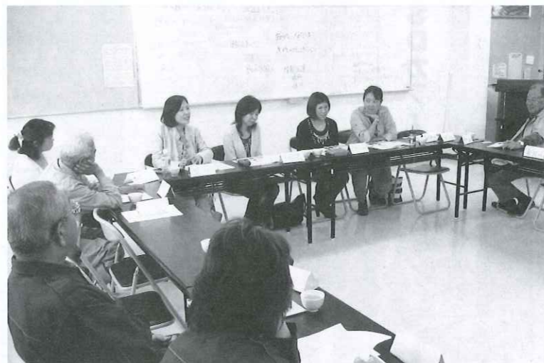
▲地域の外国人の災害に対する不安の声を聞くことから始まった第1回多国籍防災会議

こうした現状を打破し、災害に強い、安全・安心な地域社会をつくるためには、在住外国人も含めた地域の連携が必要です。そこで同館では「命に国籍はない」をキーワードに、「多国籍