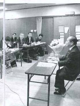
中学生からの提案で、「緑

「ピー京山」。子どもたちや地域が望 むまちづくりを具現化していく「緑 と水の道」プロジェクト。地域全体 にESDを浸透させていくための 「ESDフェスティバル」。それぞれ の活動で過去・現在・未来を捉えつつ、 地域の将来像へとつなげています。 また、子どもたちを主な活動の核に 置くことで、子どもたちが主体的に 社会参画できるようにしています。 地域の人間関係を大切にしながら 幅広い世代や学社連携で教育を