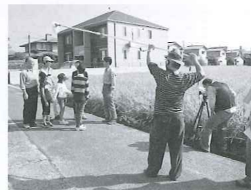
(京山地区) 「ムービー京山」活動では 高齢者も参加して映画づくりを行う