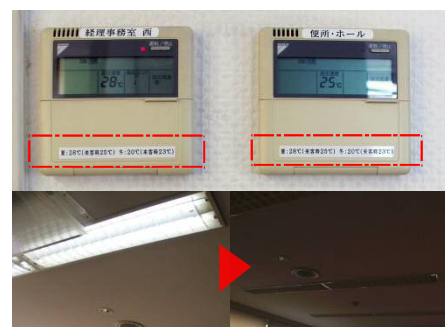
空調使用ルールの徹底。照明の自動消灯システムを導入。

今後の取り組みについて 今後も啓蒙活動の一環として大規模な清掃活動に取り組んでまいるとともに、社名のストライプが象徴する「自由」「革新」そのままに、自由な発想で「Reduce」「Reuse」「Recycle」に取り組んでまいります。