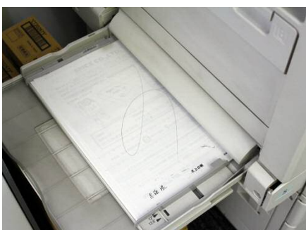
コピー用紙の裏紙を再使用。基本コピーは両面印刷を徹底。