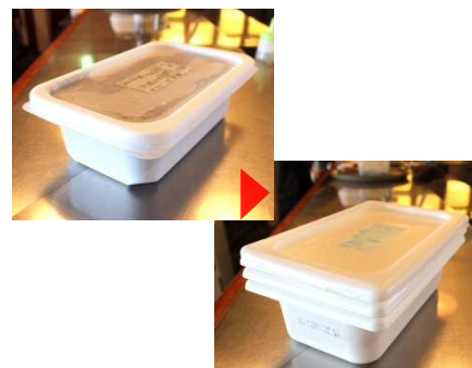
仕入食材のパッケージを保管し、食材保存などに再利用。