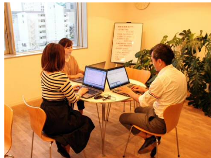
社内会議へ、PCを持ち込むことでペーパーレス化につながっている。