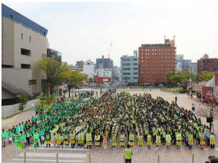
年2回社内外へ呼びかけて大規模な清掃活動を実施することで、ごみ減量化・資源化の啓蒙。

受賞にあたって 株式会社ストライプインターナショナルは1995年アパレル製造・販売会社として設立。2015年からは事業領域をライフスタイル&テクノロジーに拡げ、衣食住に関わる「モノ」「コト」の提供を通じ、お客様の生活がより豊かになる事業を推進しております。ゴミ減量化・資源化に関しましては、10年以上にわたり年2回取り組んできた清掃活動「エコクリーナーズ」が3,000名を超える規模となり、呼びかけに応じてくださった社内外の皆様と共にゴミの減量化・資源化への意識を高め、具体的な発想や行動を促す機会となっております。