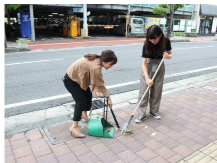
毎朝、社屋周辺の掃除に取り組んでいる。