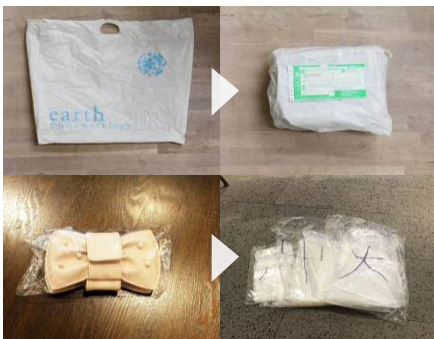
自店の使用済み商品袋(ショッパー)、などを、発送用袋として再利用。商品の包装用紙を、店舗間移動用袋としての再利用。