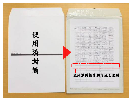
使用済の封筒を社内便の封筒に加工し、繰り返し使用。また書類をデータで管理、出力ごみの削減につながっている。