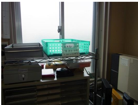
使用済み地図は、裏紙利用している。

受賞にあたって 当社は岡山市内で一般家庭ごみの収集運搬をしております岡山美装と申します。ごみ収集の会社として、会社内で出るごみは分別を徹底しております。また、収集の際に使う地図を印刷するとき、裏紙を利用しています。FAXはプレビュー画面で確認し、必要なモノだけ印刷をすることで、紙の無駄遣いを減らし、使い終わった紙はリサイクルに回しております。さらに、会社内でエコプロジェクトを立ち上げ「アップサイクル」という“不要なモノを利用し新しいモノを作り出す”という活動も行っていますし、ごみ拾いSNS“ピリカ”を利用し地域の清掃活動にも積極的に参加しております。