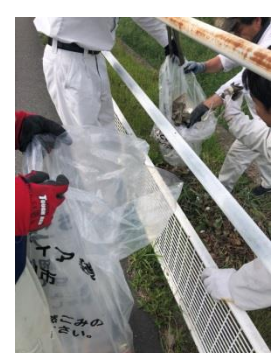
会社周辺の清掃をSNS(ピリカ)にて発信するなど、収集事業者からの新たな試みを用い、市民と協同で活動している。

今後の取り組みについて 今後も、地道にコツコツとエコ活動を続けつつ、ごみの収集会社として、市民の皆様の模範となるように精進してまいります。