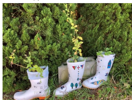
収集作業の必需品である長靴。社員の古くなり使わなくなった長靴を集めてプランターを制作した。