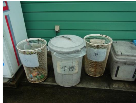
敷地内にも各種BOXを設置し、分別を行っている。