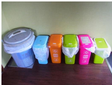
室内に各種BOXを設置し、分別を徹底している。