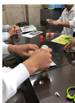
社内で減量化・資源化及び清掃活動を推進するためのグループ「エコテケ」を結成し、啓発活動を行っている。