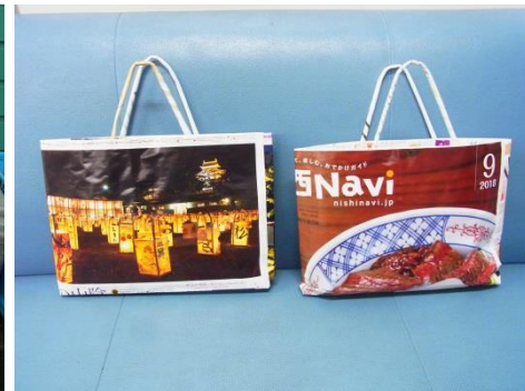
新聞やチラシを「紙バック」として来所者へ資料などを渡す際の入れ物として再利用。