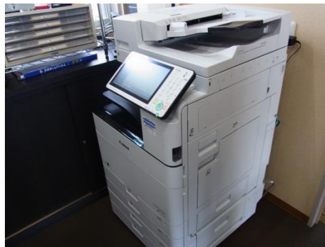
両面印刷を励行し、ごみの発生抑制に取り組んでいる。