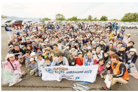
毎年コスモアースコンシャススクリーンキャンペーンに参加。

また、定期的に3R リデュース(発生抑制) リユース(再使用) リサイクル(再生利用)の観点より各人ができそうなことを提案することで取り組みの輪が広がれば幸いです。