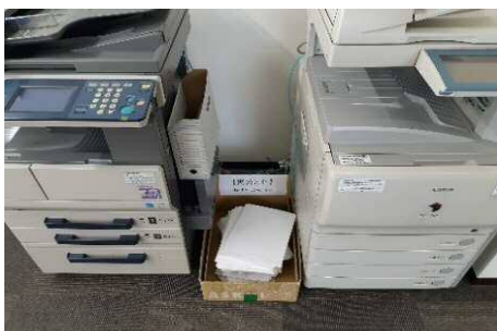
コピー用紙は両面利用するため回収し裏面利用やメモ用紙へ。