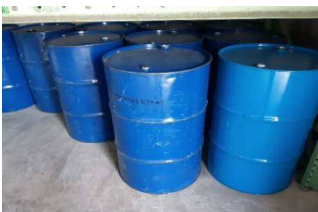
排出した廃油は再生重油として資源化。