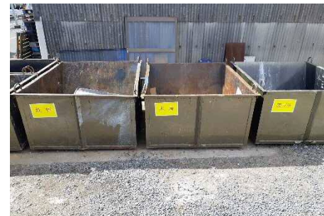
産業廃棄物は分別して、リサイクル業者にて可能な限り資源化。