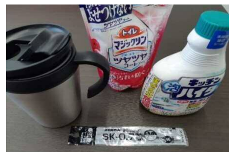
紙コップを廃止しマイカップ推奨や詰め替え品購入などでごみ削減。