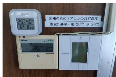
空調温度の取り決めや、LED照明化により節電。