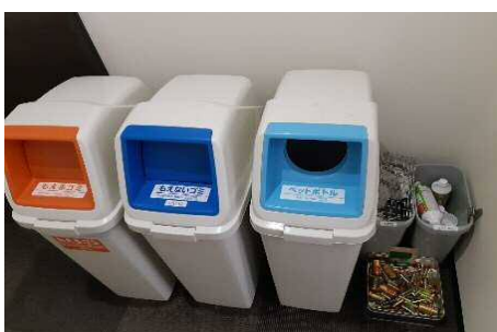
分別できるように各種ごみボックス(可燃・缶・ペット・電池・不燃)を設置。