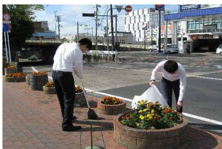
毎月、全員参加で会社周辺の清掃活動。