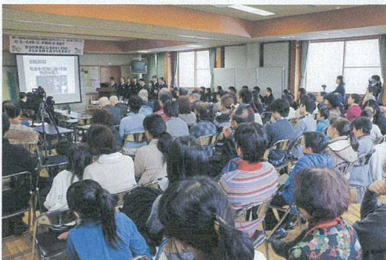
写真4 ESDフェスティバルの様子（1月30日 京山公民館にて）