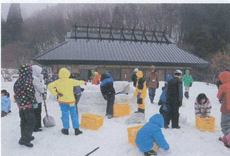
写真5 冬の源流体験エコツアーの様子（2月13日 新庄村にて）