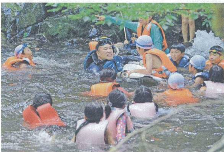
写真2 夏の源流体験エコツアーの様子（7月25日 新庄村にて）