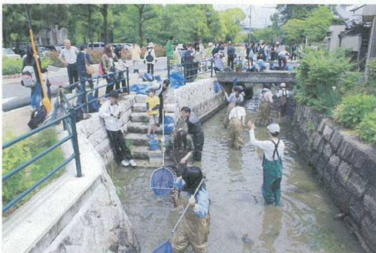
写真1 春の環境てんけんの様子（5月16日 観音寺用水にて）