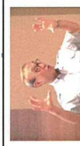
8/2 第5回 国際塾 小嶋光信 両備グループ代表 『地域公共交通の再生とまちづくりに挑戦する』 (オリエンメント美術館)