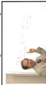
5/31 第2回 国際塾 広瀬佳司 教授 ノートルダム清心女子大学教授 『宗教の世界観と人生観』 (ノートルダム清心女子大学)