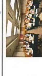
6/14 第3回 国際塾 大井聡美さん他 岡山県JICAデスク 『青年海外協力隊員に聞く』 (岡山国際交流センター)