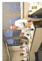
8/28 INTERKIDS懇話会 高校教育を取り巻くさまざまな課題について、教育関係者が集まり、語り合いました (岡山国際交流センター)