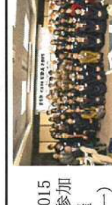
12/23 第3回ESDカフェURA2015 県下10校の高校生参加 岡山ユネスコ協会共催 (岡山国際交流センター)