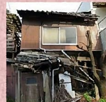
特定空家等のイメージ