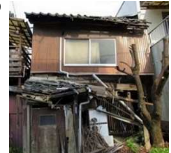
特定空家等のイメージ