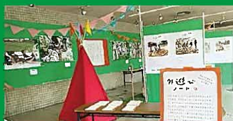
※過去の展示の様子

子どもの外遊びに役立つ情報、外遊びで作ったモノなどを展示します。それから、遊びの体験コーナーも! ぜひ、お気軽にご来場ください。観覧、体験 無料。