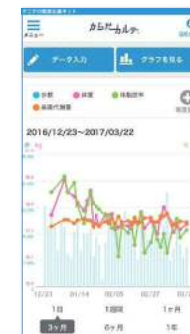
※スマートフォン画面