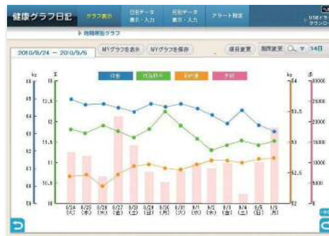
※WEBサイト(パソコン)画面

貯まったポイントはお手持ちのパソコン、スマートフォンから健康ポータルサイト「からだカルテ」で確認できます。また、計測した歩数も「からだカルテ」で確認することができます。