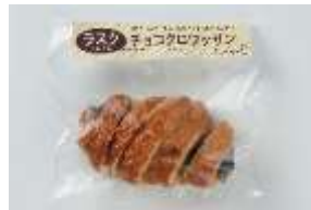
チョコクロワッサンラスク 220 円 賞味期限:製造から 60 日間