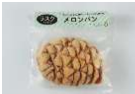
メロンパンラスク 220 円 賞味期限:製造から 60 日間