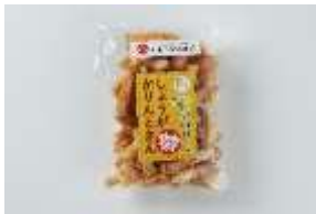
しょうがかりんとさん 220 円 賞味期限:製造から 60 日間