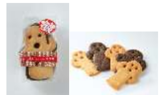
はにわクッキー 180 円 賞味期限:製造から 60 日間