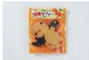
恐竜サブレ 180 円 賞味期限:製造から 50 日間