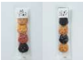
プチねこクッキー 150 円 賞味期限:製造から 50 日間