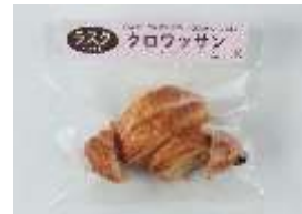
クロワッサンラスク 220 円 賞味期限:製造から 60 日間