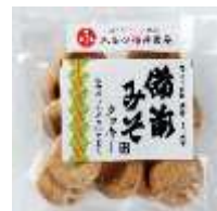
備前みそクッキー 180 円 賞味期限:製造から 50 日間