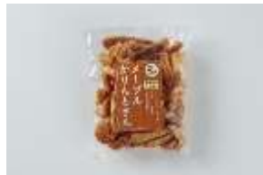
メープルかりんとさん 220 円 賞味期限:製造から 60 日間