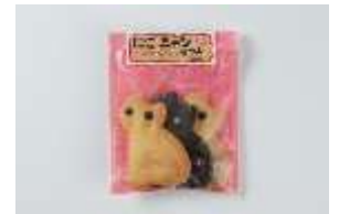
にこニャンサブレ 180 円 賞味期限:製造から 50 日間