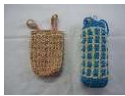
ペットボトルカバー