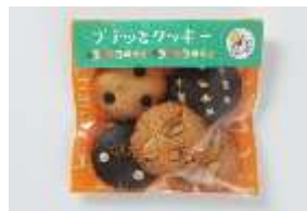
プチッとクッキー 180 円 賞味期限:製造から 50 日間