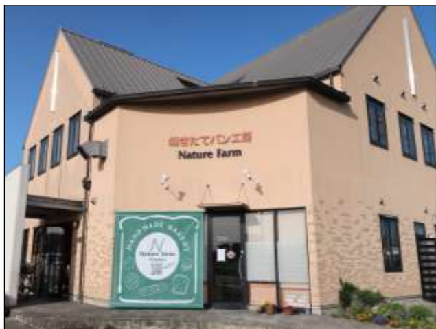
Nature Farm Atelier of roasting vertical bread and the flower