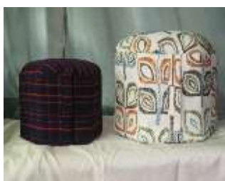
A:牛乳パック椅子 B:焼酎パック椅子