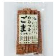
やみつぎごまクッキー 180 円 賞味期限:製造から 50 日間