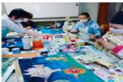
月に1回、アート教室を開催しています。