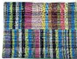
使ってみると こんな感じです♪