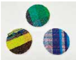
コップを置くと こんな感じです♪