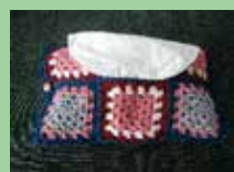
ティッシュケースカバー