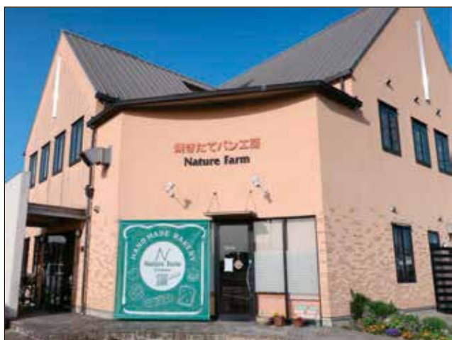
Nature Farm Atelier of roasting vertical bread and the flower