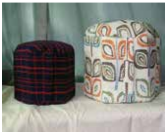
A:牛乳パック椅子 B:焼酎パック椅子