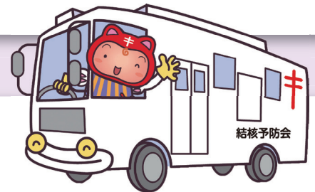
複十字シール運動イメージキャラクター シールぼうや

結核の発見が遅れると、重症化して入院が長引いたり、周りの方々への感染拡大のリスクが高まることから、定期健康診断等で早期に発見することが大切です。