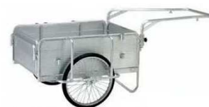
折りたたみ式リヤカー