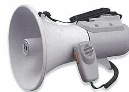
ショルダー型メガホン