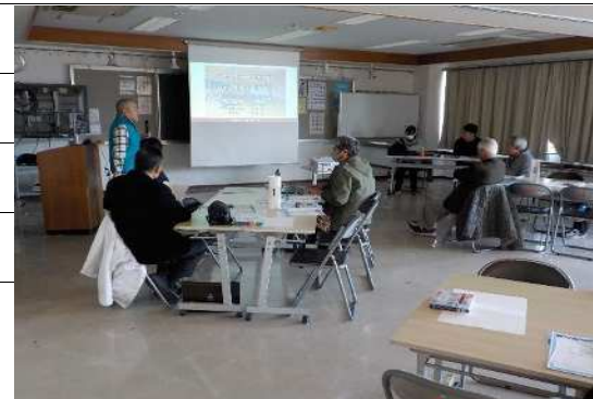
防災訓練の発表風景