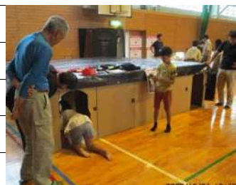
まっくらレスキュー迷路