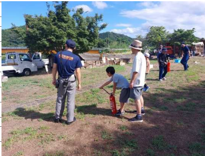
水消火器による消火訓練