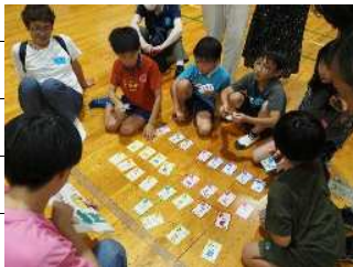
防災クイズ なまずの学校