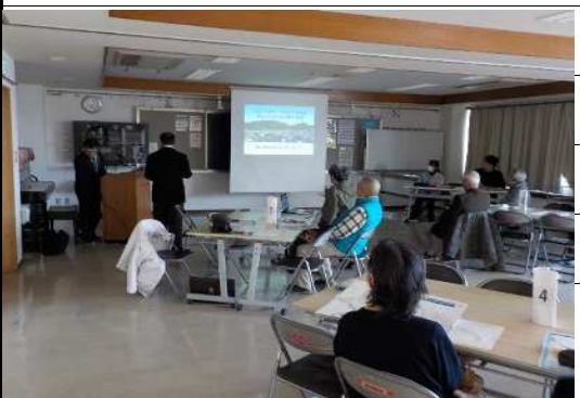
防災訓練の発表風景