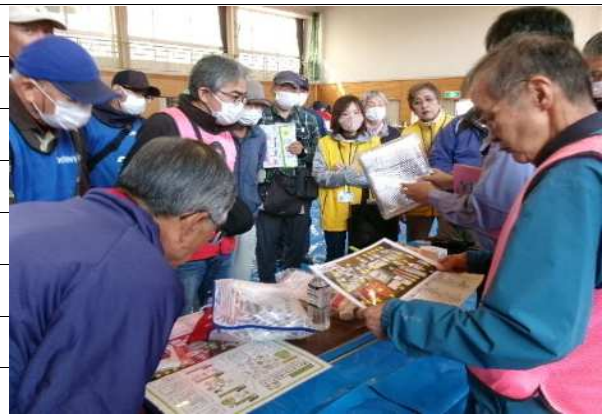
持ち出し袋の説明