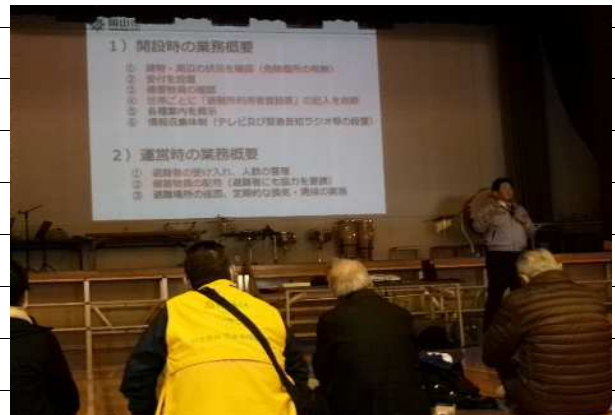
危機管理室講師の説明