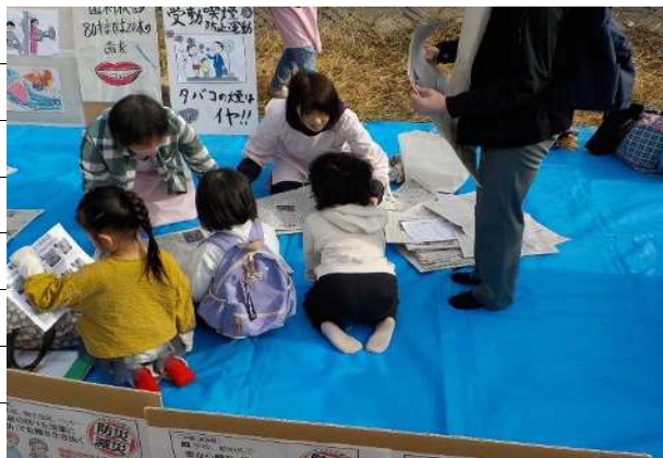
スリッパ作り体験