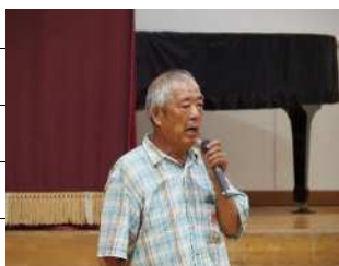
副実行委員長のあいさつ