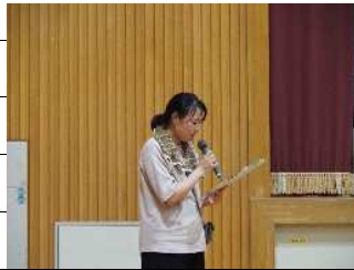
スケジュール説明