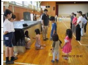
まっくらレスキュー迷路