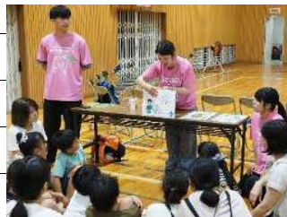
防災クイズ シャッフル