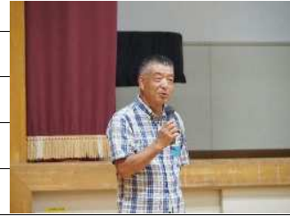
実行委員長あいさつ