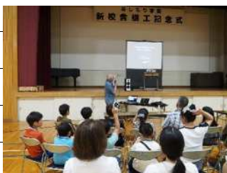
北極星の見つけ方