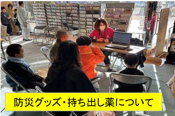
防災グッズ・持ち出し薬について