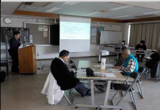
防災訓練の発表風景