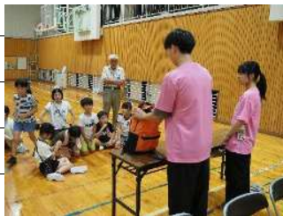
非常持出袋の備品と大切さを説明