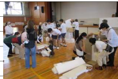
簡易ベッド組み立て