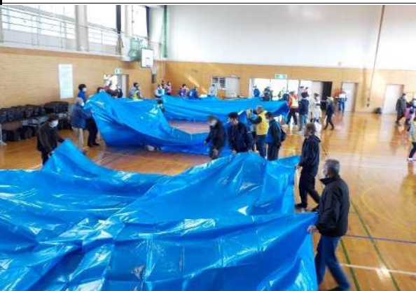
会場づくり(区分け)