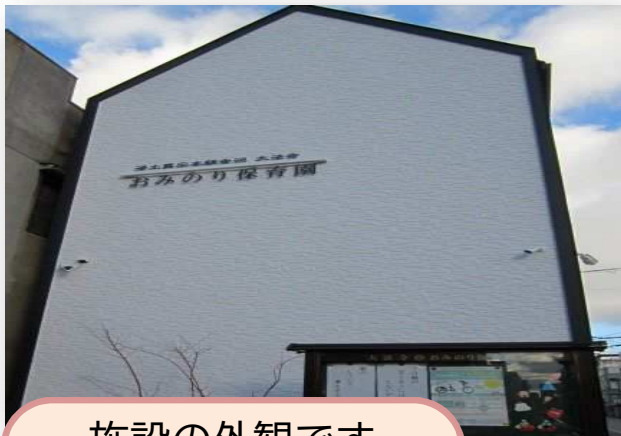
施設の外観です お寺に隣接しています