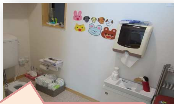
トイレは保育室の横にあるので 同線もばっちり！