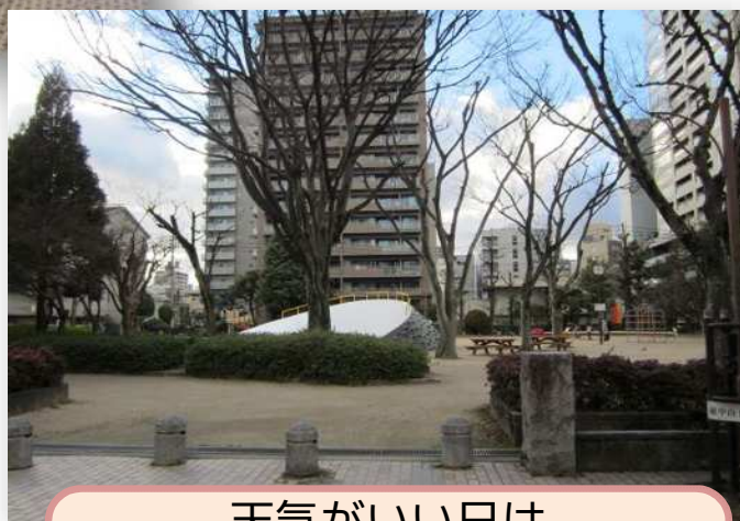
天気の良い日は 深抵ガーデンや東中山下公園へ お散歩に行きます ☀