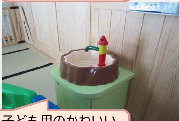
子ども用のかわいい 手洗い場も完備