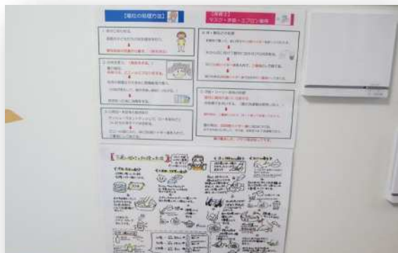
衛生面にもしっかり配慮されており 職員間で共有されています