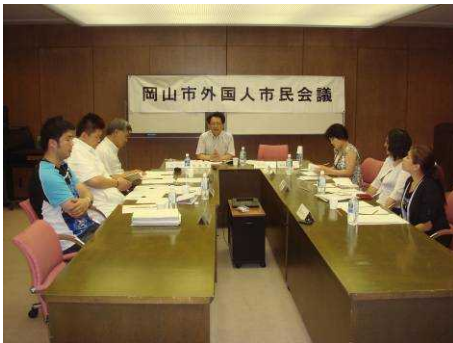
だい かいかいぎ ようす 第8回会議の様子

ない よう ねんきん 【内 容】 (1) 年金について せいれいしていとしいこうご おかやまし のぞ (2) 政令指定都市移行後の岡山市に望むこと (3) その他