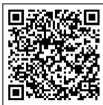
岡山市 HP 子宮頸がん