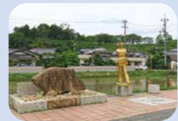
駐車場の吉備国の大王像

造山古墳駐車場を発着の約2時間のコース 古墳下のガラス工房横から登り、後円部から高松地区を望む、荒神社の石棺を見て下る。千足装飾古墳、付近の第一から第六古墳を見る。吉備路自転車道を進むと吉備のかげぼうし(日時計)がある。こうもり塚古墳の石棺、総社吉備路文化館、備中国分尼寺跡から復路、造山古墳の下の牧場に馬がいる。