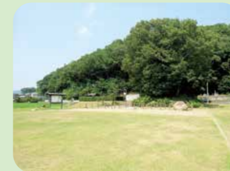
蛙が鼻 高松城水攻め 築堤跡

高松公民館を発着の約2時間30分のコース 高松公民館を出て湛井十二箇郷用水(岩崎用水)沿いに進み、蛙が鼻を経由して吉備高原自転車道を稲荷方向へ進む。 最上稲荷へは寄らず帰路へ進み、高松城址公園散策後、高松公民館へ帰るコース。