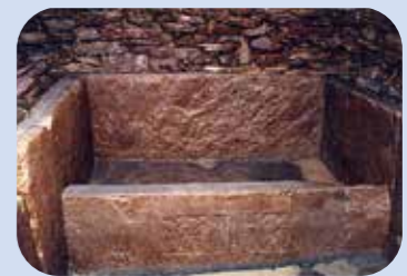
千足装飾古墳の内部