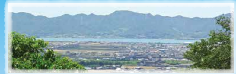
芥子山頂上から見た風景