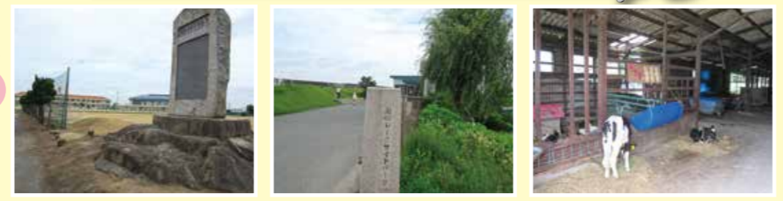
七区小学校 北七区 灘崎レークサイド 牛舎