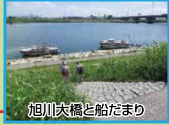
旭川大橋と船だまり