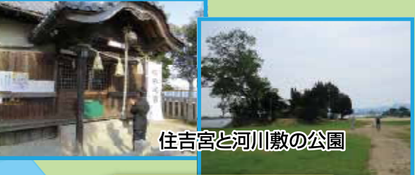
住吉宮と河川敷の公園