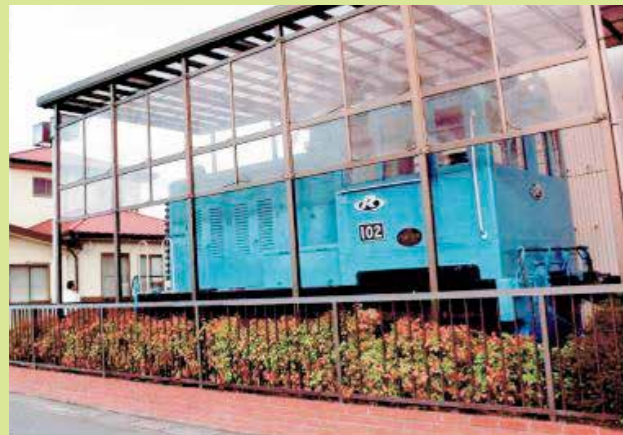
岡山臨港鉄道の当時の車両