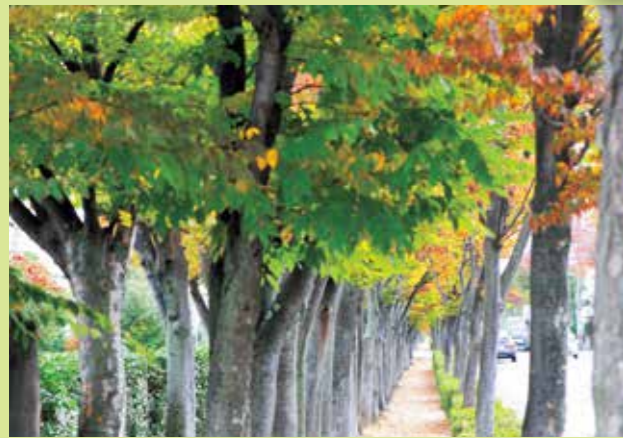
緑うつくしいけやき通り(十一番川沿い)