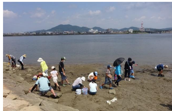
連携中枢都市圏事業 『干潟の植物と生き物観察隊!!』