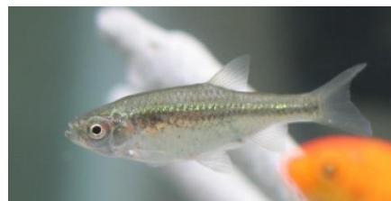
種の保存法 特定第二種国内希少野生動植物種 カワバタモロコ