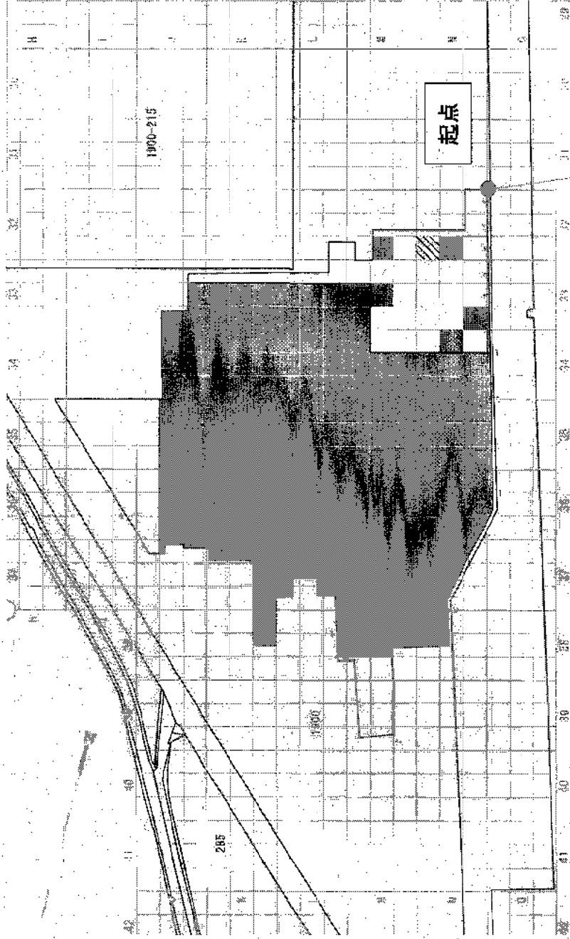
(別図) 一部指定解除する区域