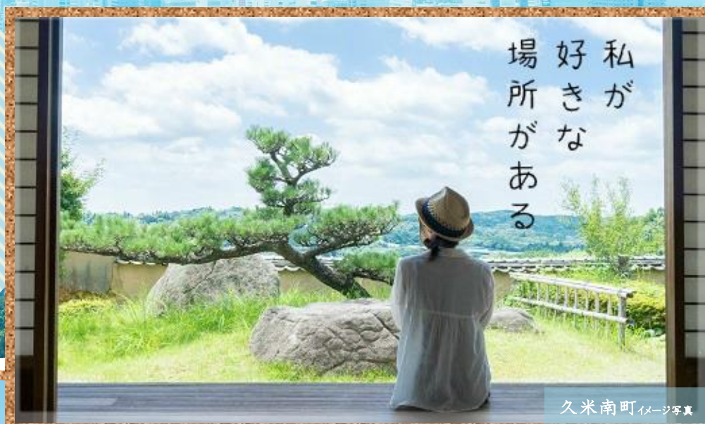
久米南町イメージ写真