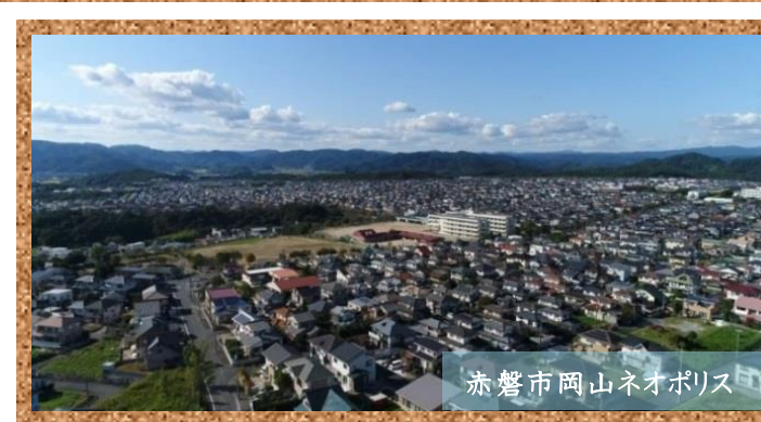
赤磐市岡山ネオポリス