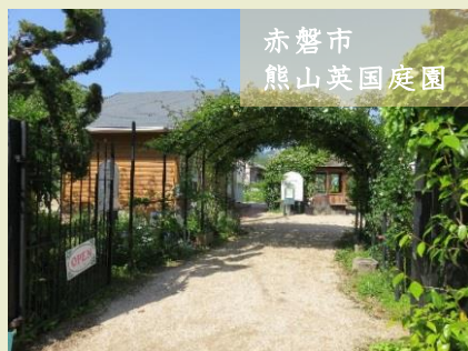
赤磐市 熊山英国庭園

※岡山市の行程については、 ツアー参加者のご希望により 変更することがございます。 あらかじめご了承ください。