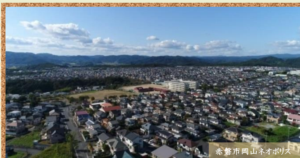
赤磐市岡山ネオポリス