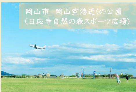
岡山市 岡山空港近くの公園 (日応寺自然の森スポーツ広場)