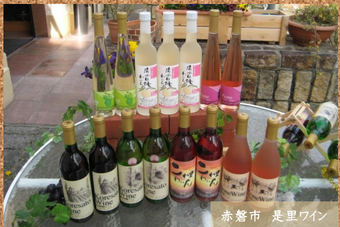
赤磐市 長里ワイン